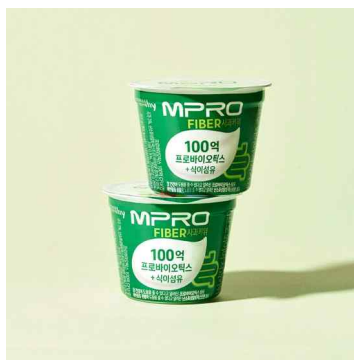
MPRO 파이버 사과키위