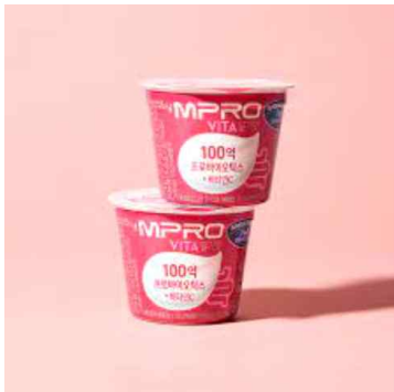
MPRO 비타 딸기맛