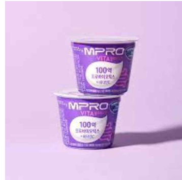
MPRO 비타 블루베리맛