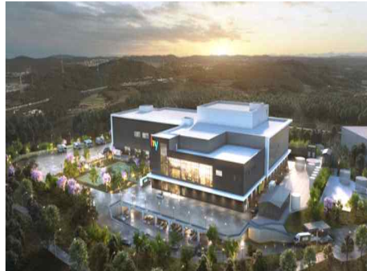
(24년 준공예정 신공장)