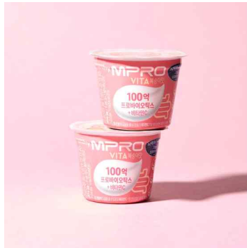
MPRO 비타 복숭아맛