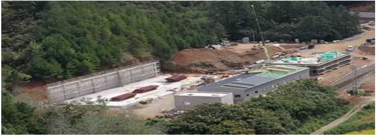
[케이디솔루션 현재 신축 중으로 '24년 3월 준공완료예정]