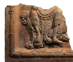
Green-glazed Tile with Heavenly Guardian King Design