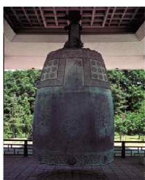
Divine Bell of King Seondeok | National Treasure