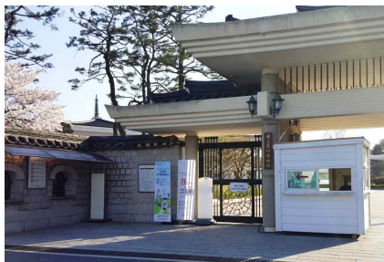
Meeting Point Main Gate

e-mail (gjmuseum@korea.kr) phone (+82-54-740-7537)