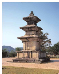
Three-Story Stone Stupa from Goseonsa Temple Site | National Treasure