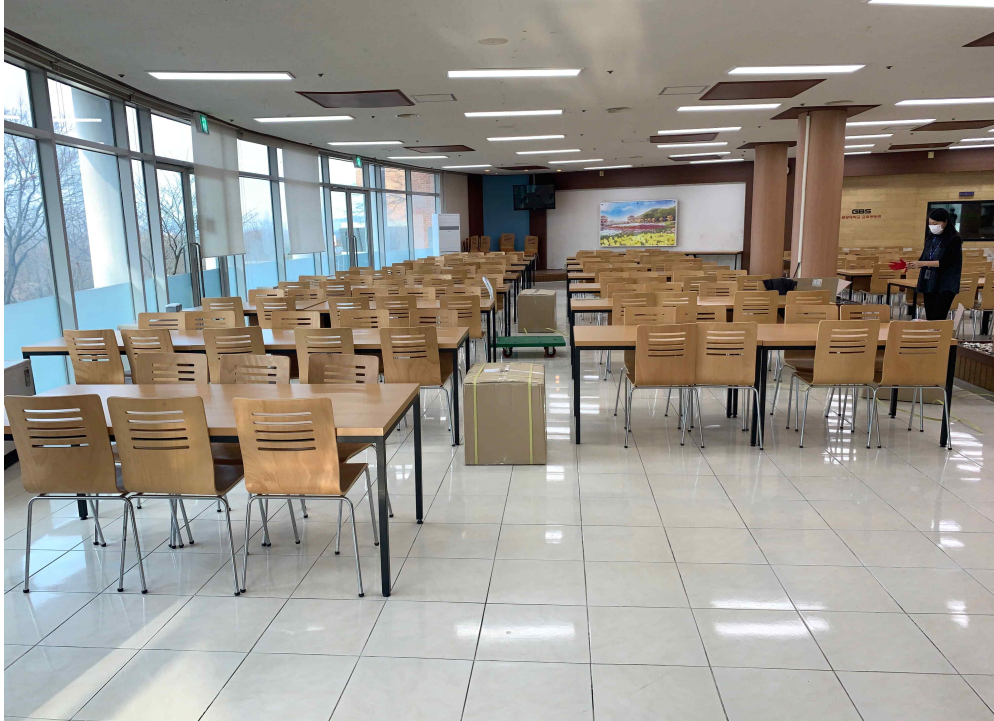
식당 가림막 설치 후